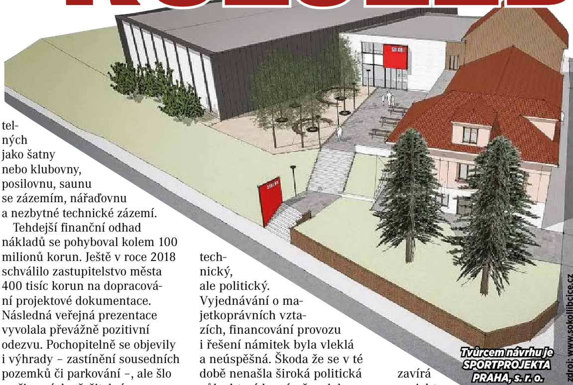
Tvůrcem návrhu je SPORTPROJEKT PRAHA, s. r. o.