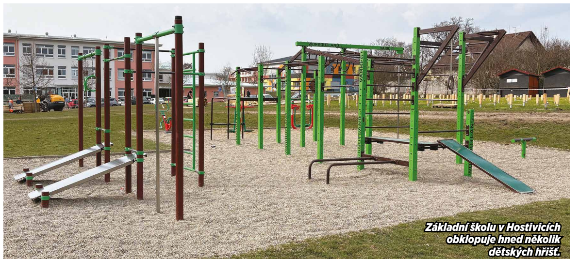
Základní škola v Hostivicích obklopuje hned několik dětských hřišť.

Některá města se tomuto nepříznivému trendu snaží vzdorovat. V Hostivicích budují stezky, díky nimž jsou školy dostupné z domova pěšky, investují do víceúčelových hřišť, maximálně podporují lokální oddíly a drží se koncepce „sport pro rodiny dostupný hned za rohem“. Nebo například Cheb, držitel titulu „Evropské město sportu“, otevřel školní areály veřejnosti i o víkendech a investoval miliony do volnočasových parků. V Libčicích sportoviště slouží téměř výhradně oddílům, nikoliv široké veřejnosti.