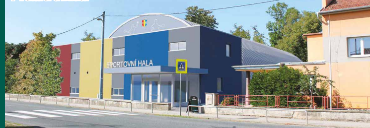
Vizualizace haly v Telnici u Brna.