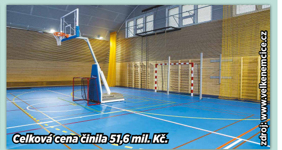
Celková cena činila 51,6 mil. Kč.

rozpočtu, o to víc jsme byli úspěšní při samotné výstavbě.“ A k té podotýká: „I když jsem byl osobně z počátku skeptický k velikosti a volil bych menší prostor, dnes jsem za to rád. Je dobré, že dnes máme zařízení tohoto