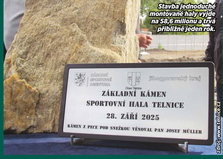
Stavba jednoduché montované haly vyjde na 58,6 milionu a trvá přibližně jeden rok.

absorpční pěnou vhodný pro všechny halové sporty. Komfort pro hráče i fanoušky zajistí dvoupodlažní přístavek se čtyřmi šatnami a tribunou pro 200 diváků. Cena činí necelých 59 milionů korun a Národní sportovní agentura poskytne dotaci 30 milionů korun, obec zaplatí zbytek. Základní kámen byl položen v září 2025, momentálně probíhá montáž nosné ocelové konstrukce a dokončení se plánuje letos na podzim. Hala je projektována jako víceúčelová a díky použití speciálních obkladů se zlepšší akustika natolik, že se tu budou pořádat plesy i koncerty bez nepříjemné ozvěny.