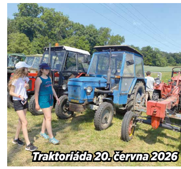
Traktoriáda 20. června 2026