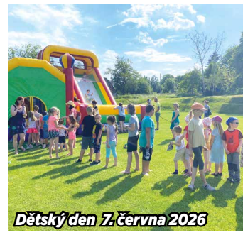
Dětský den 7. června 2026